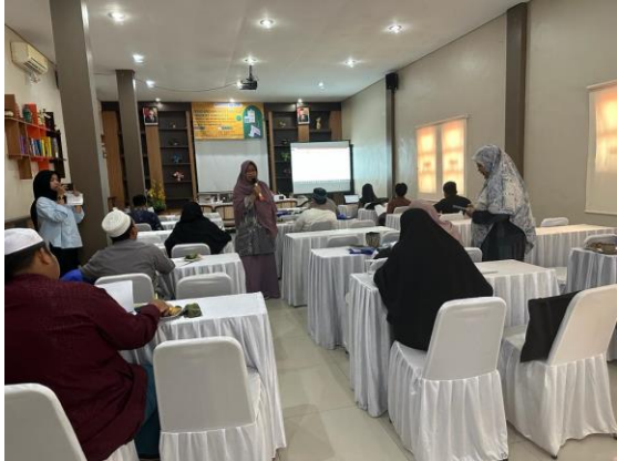
Gambar 3. Instruktur Membantu Peserta

keuangan, dan laporan arus kas. Peserta diarahkan menggunakan format sederhana sesuai standar akuntansi yang berlaku untuk organisasi nirlaba (PSAK 45). Dengan melibatkan staf keuangan pesantren secara langsung, kegiatan ini berhasil meningkatkan kesadaran akan pentingnya transparansi dalam pengelolaan dana.