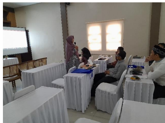
Gambar 2. Instruktur Memberikan Petunjuk

Bimbingan Menyusun Sistem Akuntansi. Instruktur memberikan pelatihan intensif mengenai sistem pencatatan akuntansi berbasis prinsip double entry. Fokus pelatihan adalah membangun pemahaman dasar terkait jurnal, buku besar, dan laporan keuangan.